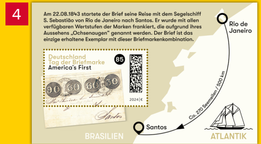
Alle Abb. Muster.